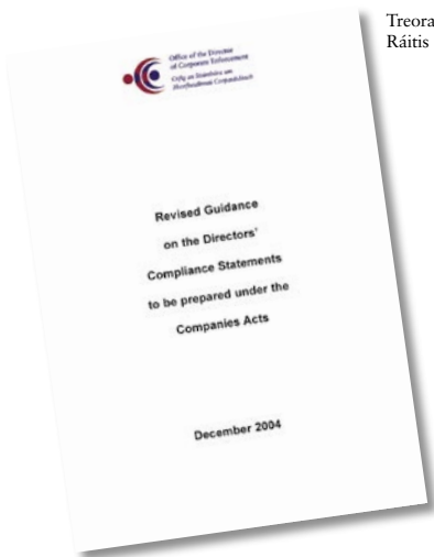
Treorach Athbhreithnithe ar Ráitis Ghéilliúntais Stiúrthóirí