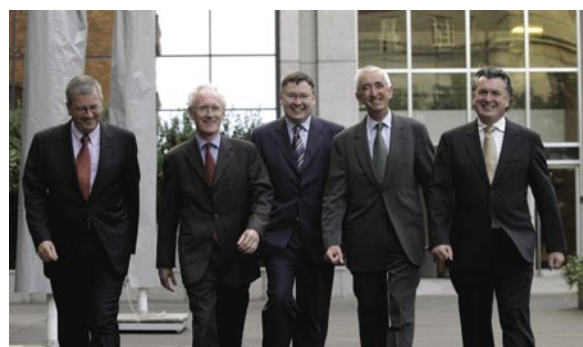
Chuir an Stiúrthóir faisnéis i lathair do ACII faoi riachtanais Ráitis Ghéilliúntais Stiúrthóirí

I rith na bliana 2004, rinne an Stiúrthóir roinnt leasuithe maidir leis na cumhachtaí a tharmlichtear do bhaill foirne sonraithe faoi alt 13 an Achta um Fhorfheidhmiú Dlí Cuideachtaí 2001 d'fhonn treisiú