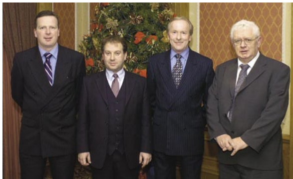
At the Seminar on Taxation

Ainneoin ualach mór oibre a bhfuil fás seasta ag teacht air, d'éirigh leis an Oifig méadú a chur ar líon agus ar réimse na gcaingean forfheidhmithe sibhialta agus coiriúla agus baineadh amach roinnt breitheanna Cúirte i dtaca lena chúram sainordaithe.